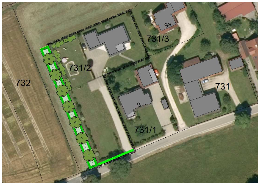
Darstellung unmaßstäblich (verändert)

Der Gesamtumfang der Satzung erstreckt sich auf eine Gesamtfläche von 2.784m 2 .