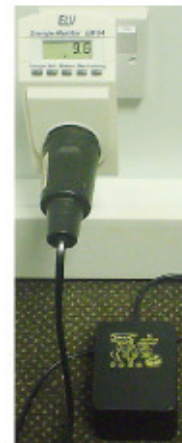
Fig.22.1: Ein schrecklicher Trafoadapter einer Ikea-Lampe, der Adapter verbraucht fast 10 W wenn die Lampe aus ist!

Nach Angaben der International Energy Agency trägt der Standby-Strom mit etwa 8% zum häuslichen Strombedarf bei. In England und Frankreich liegt die mittlere Standby-Leistung bei etwa 0,75 kWh/d pro Haushalt. Dabei ist das Problem nicht der Standby-Betrieb selbst - es ist die billige Art seiner Implementation. Standby-Systeme mit weniger als 0,01 W sind perfekt machbar; doch Hersteller, die sich hier einen Cent in den Herstellungskosten sparen wollen, belasten so die Verbraucher mit jährlichen Kosten einiger Euros.